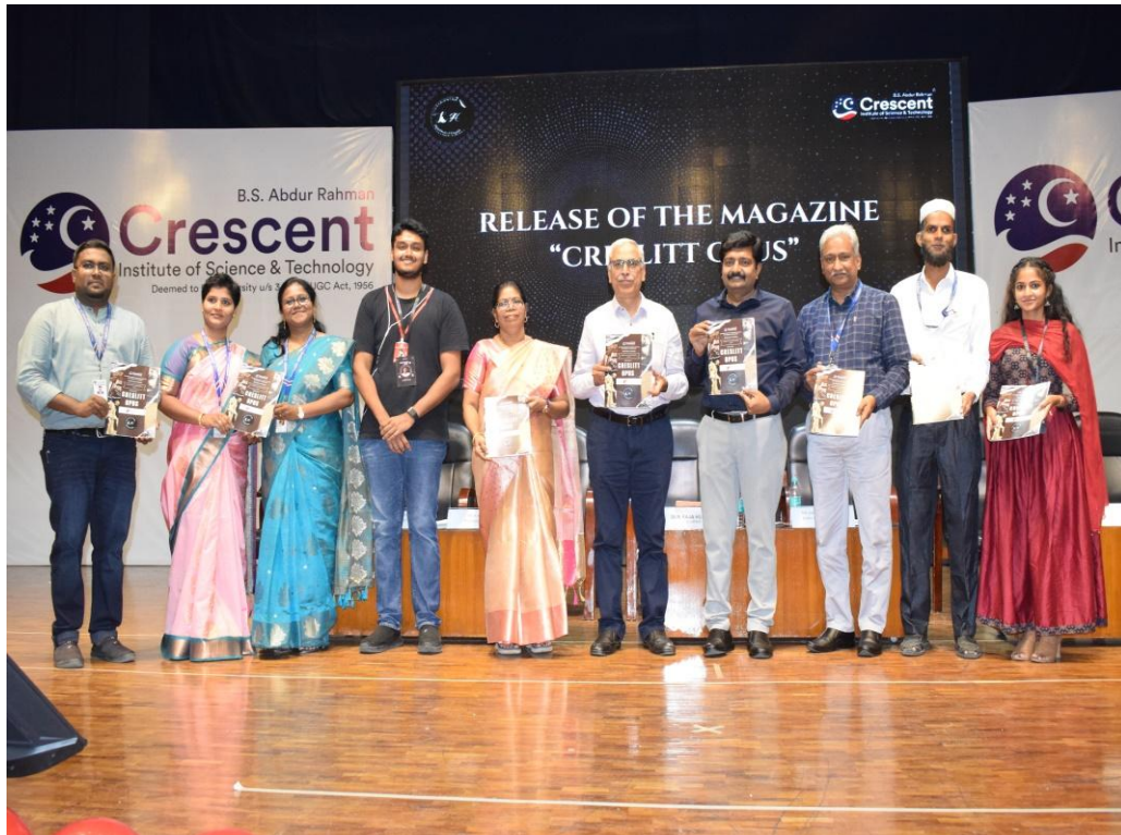
Release of the magazine Creslitt Opus '25