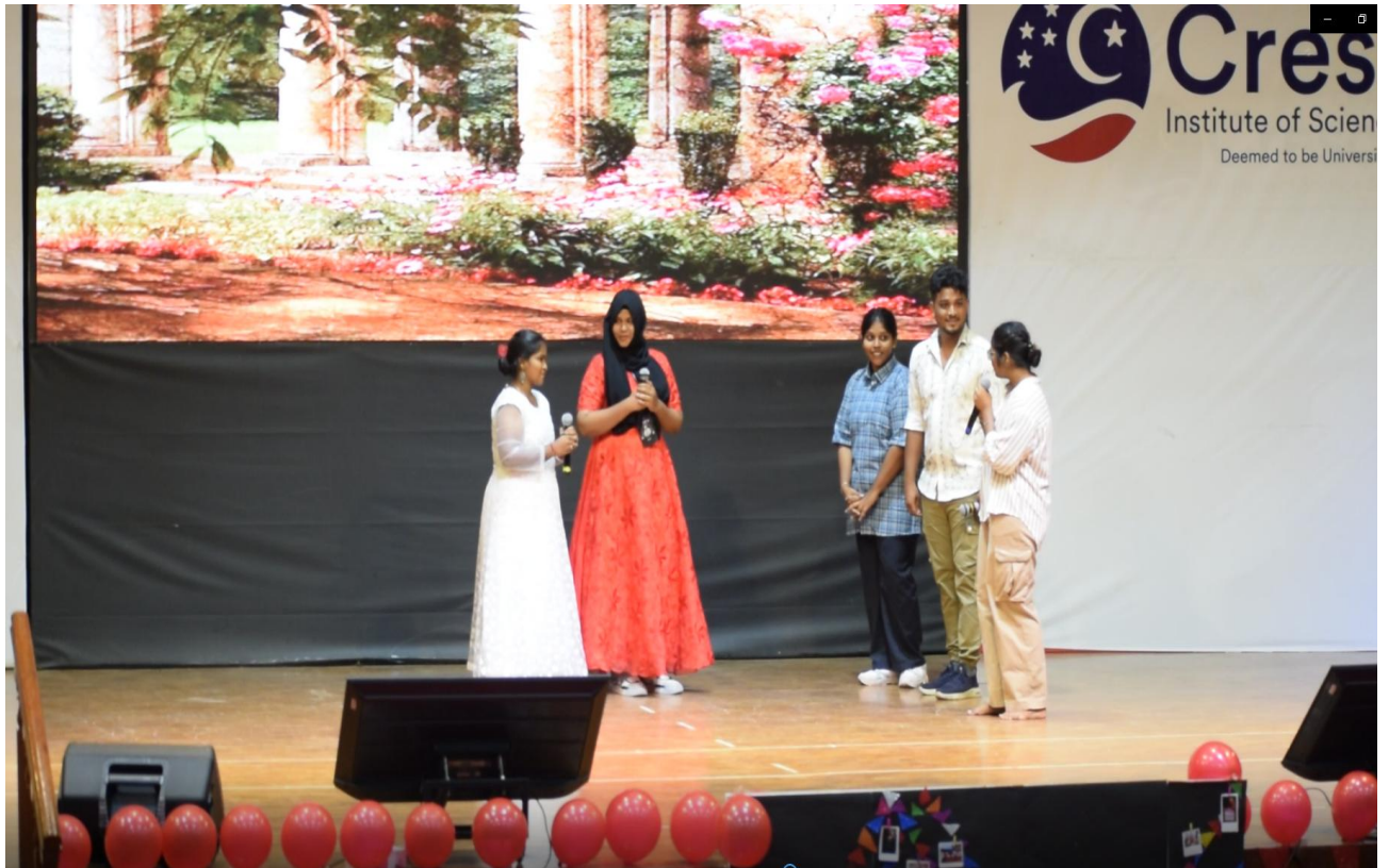
Drama performance - Adaptation of Merchant of Venice by B.A. English Students.